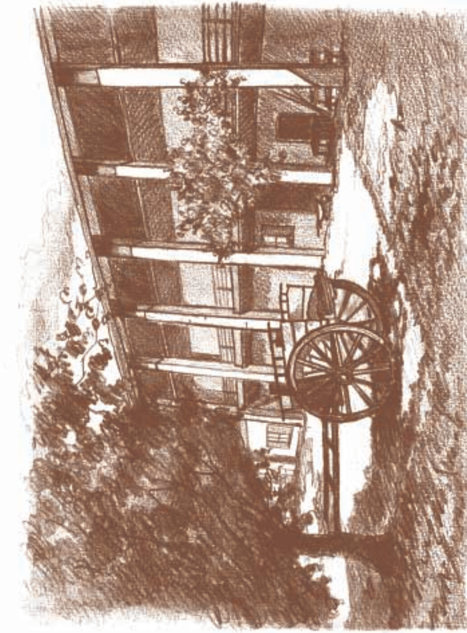
Progetto grafico: studio VS di arch. Valerio Sola